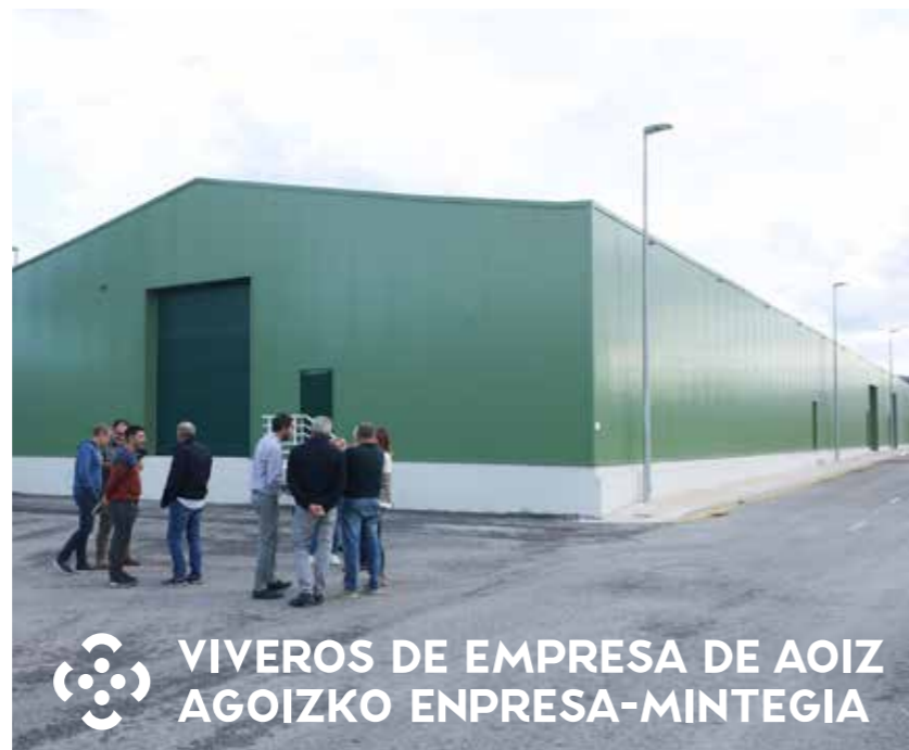
VIVEROS DE EMPRESA DE AOIZ AGOIZKO ENPRESA-MINTEGIA

Turismo proiektuak ere azaldu ziren: Pirinioarreko Turismo Jasangarritasuneko Plana; merkataritza; Landa Merkataritza Dinamizatzeko Sarea; zerbitzuak, baita ingurumenarekin zerikusia dutenak ere (klimaren, energia aurretaren eta 2030eko agendaren aldeko alkatetza-ituna); kultura-ondarea; eta proiektu enblematikoak, hala nola Iratiko Bide Naturala, 2025ean martxan jarri arte obrak egiten jarraituko duena, Pirinioarreko Turismo Kudeaketako Unitatea, Zangozako Eskualdea, 2025era arte 4,7M €-ko proiektu onartua eta 200.000 €-tik gorako udal-proiektuei eragingo diena, Itoizko urtegitik eratorritako proiektuak eta planak, Ekaiko Zerrategiaren auzoa berreskuratzea edo Depentsa Ehuntzen proiektua, besteak beste.