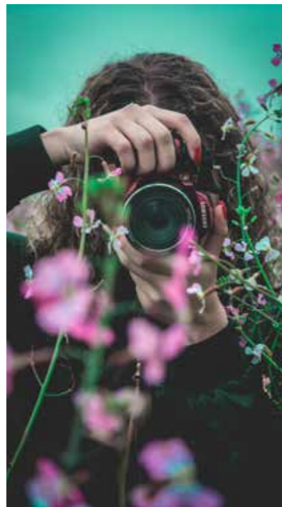
Orokorra, herritar guztientzat irekia, eta herrikoia, Agoitzen

Agoizko Udalak, Kultura eta Fes- tetako zinegotzigoaren bitartez, «Agoitz Hiria» argazki lehiaketa- ren edizio berri bat deitu du, eta guztira 800 euro banatuko ditu saritan. Argazki lehiaketa honen hamargarren edizioa da, eta Udalak Agoizko une edo eszena esanguratsuenak atzematera ani- matzen du parte hartzen duena. Izan ere, oinarriek nahitaezko betekizuntzat ezartzen dute ar- gazkiek Agoizko hiribildua izango dutela gaitzat: paisaiak, hirigintza, ondarea, ohiturak, jaiak, bertako jendea... eta originalak, argita- ragabeak eta beste lehiaketa ba- tzuetan saritu gabeak izan be- harko dute. Gainera, zuri-beltzean edo koloretan izan daitezke.