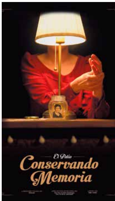
FRIDA Asociación Navarra de Fibromialgia, Síndrome de Fatiga

Horrez gain, Agoizko Kultur Etxean aurkeztu zen El mal invisible: relatos sobre la fibromialgia , Nafarroako Idazleen Elkartearen eta