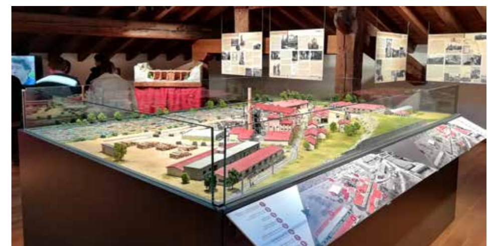
Agoizko Udalak, LGENF Europako Funtzak eta Nafarroako Gobernuak (Cederna-Garalurrek kudeatzen duen 2014-2020 aldirako LGPren bidez) finantzatu dute proiektua.