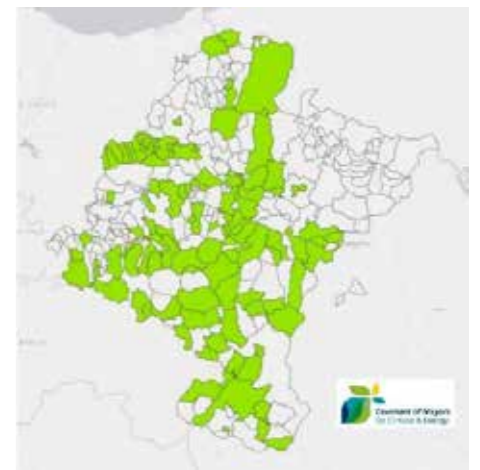
Ayuntamientos firmantes del Pacto de Alcaldías.

En concreto, las entidades locales firmantes del Pacto se comprometen a presentar, en el plazo de dos años a partir de la decisión del pleno municipal, un Plan de Acción para el Clima y la Energía Sostenible (PACES) con las acciones clave que pretenden acometer. El plan incluye un Inventario de emisiones de referencia (año 2005), y una Evaluación de los riesgos y vulnerabilidades climáticas. La meta es que la mayoría de las entidades locales de Navarra adopten una política de clima y energía corresponsable con los compromisos de la Comunidad Foral y de la Unión Europea. Hasta la fecha, los municipios adheridos suman casi 500.000 habitantes,