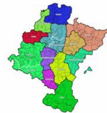
12 COMARCAS REFORMA LOCAL DE NAVARRA

Una vez la propuesta tiene el visto bueno de la FNMC, y el texto sea llevado al Parlamento, los diferentes grupos políticos podrán presentar enmiendas y cambios al texto. Seguiremos informando, y cuando tengamos un texto más definitivo, os contaremos con más detalle la propuesta.